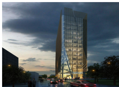
Imagen N.º 3 Edificio Anexo E del Poder Judicial

Fuente: Render del proyecto, edificio Anexo E. Fideicomiso Inmobiliario del Poder Judicial 2015, con el Banco de Costa Rica.